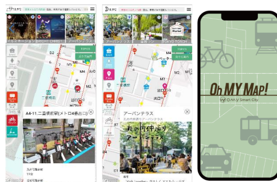
前回提供時イメージ