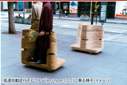
低速自動走行モビリティ(ino type-S712)に乗る様子(イメージ)

・事前予約は不要です。乗車希望の方は走行中のモビリティに定員3名まで自由に乗降可能です。なお、ルートの発着場所となる①(有楽町電気ビル・仲通り側角)、④(新有楽町ビル・有楽町駅側入口付近)、⑤(Slit Park(新国際ビル内))では乗換制となりますので順番に譲り合ってください。乗車後はアンケートにご協力をお願いいたします。 ※混雑でお待ちいただく場合がございますご了承ください。