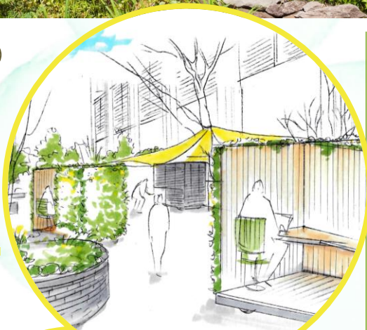
※ワークプレイスイメージ

取得したデータから、緑の持つ多様な機能を検証するとともに、当地区の就業者のニーズを把握することで、今後の緑を活かしたまちづくりに繋げていきます。