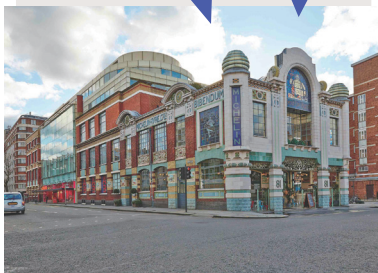
改修されたミシュランビル(レストラン「ピバンダム」とザ・コンランショップ 1987年改修)