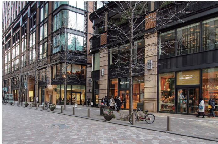
「丸の内ブリックスクエア」付近の丸の内仲通り。歩道にも車道にもアルゼンチン斑岩を使い、段差を少なくすることによって、空間としての連続性を高めている。