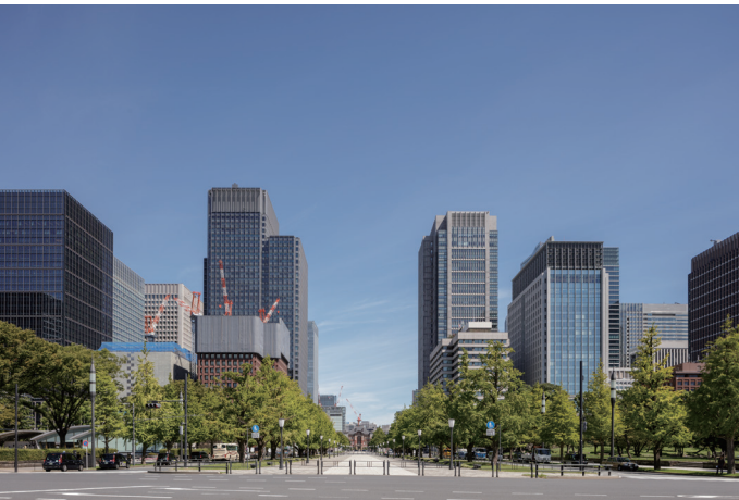
行幸通りからは、はるか先までを見渡すことができる。いくつもの超高層ビルと東京駅丸の内駅舎が対照的。新旧の建築が共存して、この景観が生まれている。