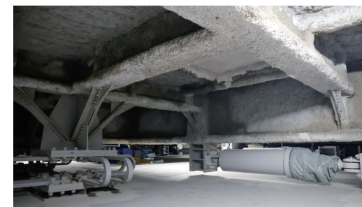
ビルは本館と南館の2棟構成で、本館は3階と4階の間、南館は5階と6階の間に中間層免震構造を採用。「U型鋼材ダンパー(左)」「オイルダンパー(右)」「天然ゴム系積層ゴム支承」の3種類の免震材料が、地震のエネルギーを抑制。免震層から上の階の揺れを吸収する構造となっている。