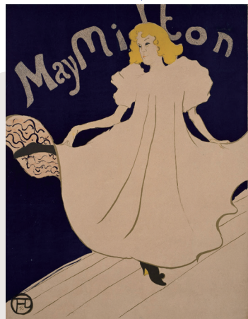
アリド・トゥールーズ・ロートレック(メイ・ミルトン) 1895年リトグラフ/紙(二色) 号館美術館蔵