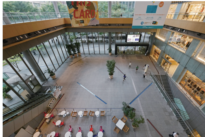
丸ビル1階の「マルキューブ」は、幅、奥行き、高さがすべて約30メートルという、まさにキューブ状のアトリウム。ガラス張りで、丸の内仲通りとの一体感が心地いい。